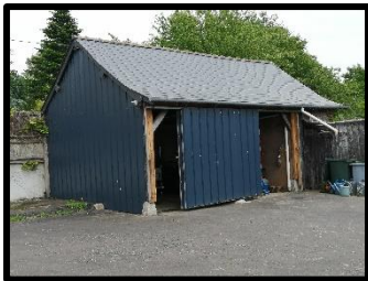
Achèvement des travaux de l'atelier communal