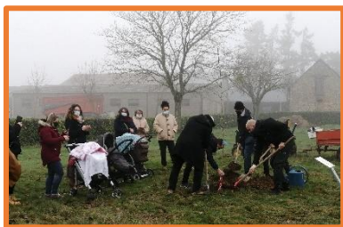
Les parents sont venus planter un arbre Ginkgo biloba pour la naissance de leur enfant sur le terrain communal