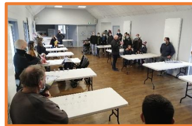
La mairie a rassemblé les nouveaux habitants (16 familles). Un sous-main leur a été offert.